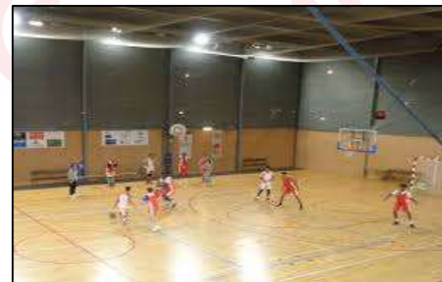
2 salles d'entraînements